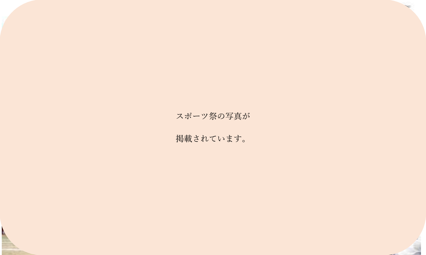
スポーツ祭の写真が