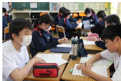
グループ活動の様子

総合的な学習の時間では、福祉について学習を進めています。車いす、手話、知的障害などの分野からひとつ選び、その分野について、グループで学習活動を行っています。グループ活動では、毎回リーダーを決めて、活動を取り仕切ったり、教室で状況を報告したりします。6月13日（木）に行われる福祉実践教室に向けて学習を進め、それまでの成果をまとめたものを9月の発表会で報告する予定です。