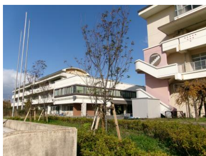
3月に植樹したぐんぐん育つ桜の木