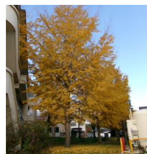
今が最高に見頃の体育館裏のイチョウ